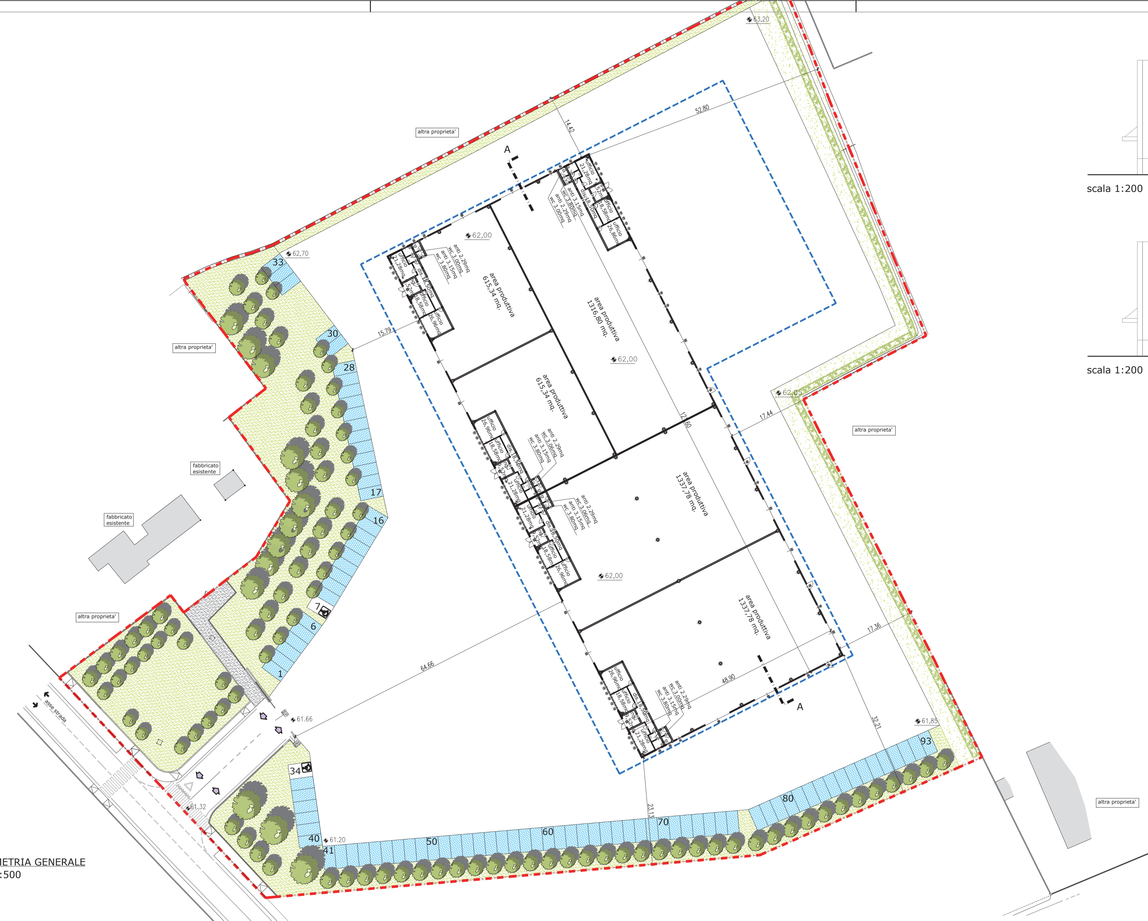
PLANIMETRIA GENERALE scala 1:500